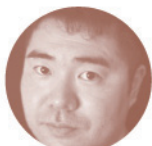
HORITAKA NSK IN HOUSE: 1997 CURRENT WORKSPACE: STATE OF GRACE- AS APPRENTICE OF HORIYOSHI III